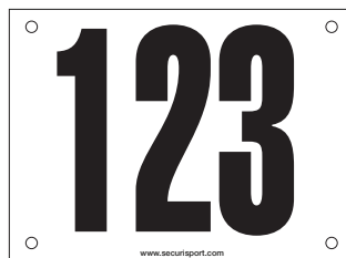
12-5001-X, 12-5002-X, 12-5003-X 6" x 7"3/4 15cm x 20cm