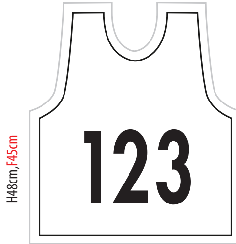
H42cm, F35cm 12-6002-x